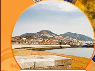
ซาจื่อไห่