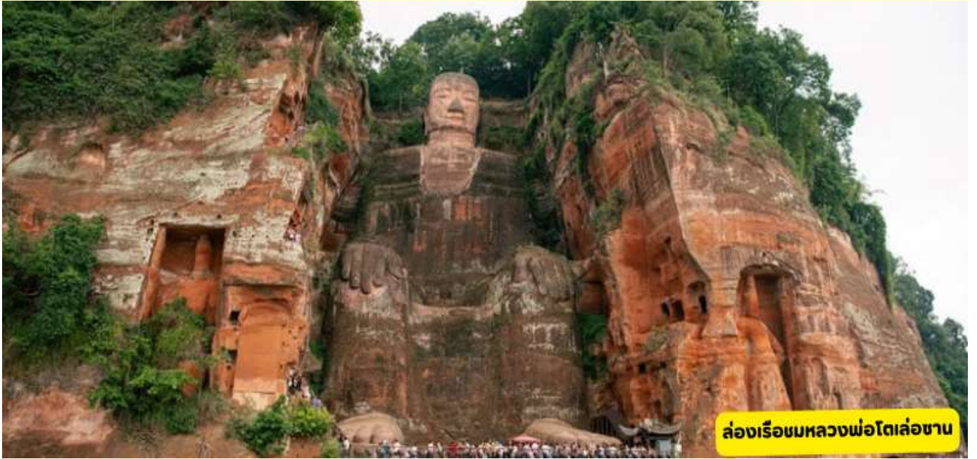
ล่องเรือชมหลวงพ่อดโตเล่อซาน

เมืองเม่าเสียน – เมืองตูเจียงเยียน – เมืองเล่อซาน – ง้อไบ๊