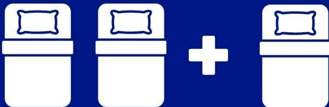
ห้องพักสำหรับสามท่าน (ที่นอนเสริม) TRIPLE BED ROOM (TRP)