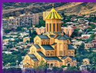
โบสถ์ศักดิ์สิทธิ์กริบตี