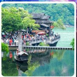
หมู่บ้านชาวน้ำเสี่ยเหมินเจีย