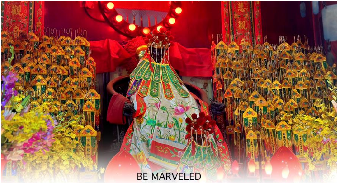
BE MARVELED วัดเจ้าแม่กวนอิมฮวงอ้า (ยิมฮิน)

ให้เดินทางกลับไปกราบไหว้ และขอบคุณเจ้าแม่กวนอิมอีกครั้ง โดยเตรียมชุดไหว้และกระดาษาเงินกระดาษาทองที่เป็นเหมือนเงินที่เรานำมาคืน เป็นการไหว้เพื่อคืนเงินเจ้าแม่กวนอิมนั่นเอง