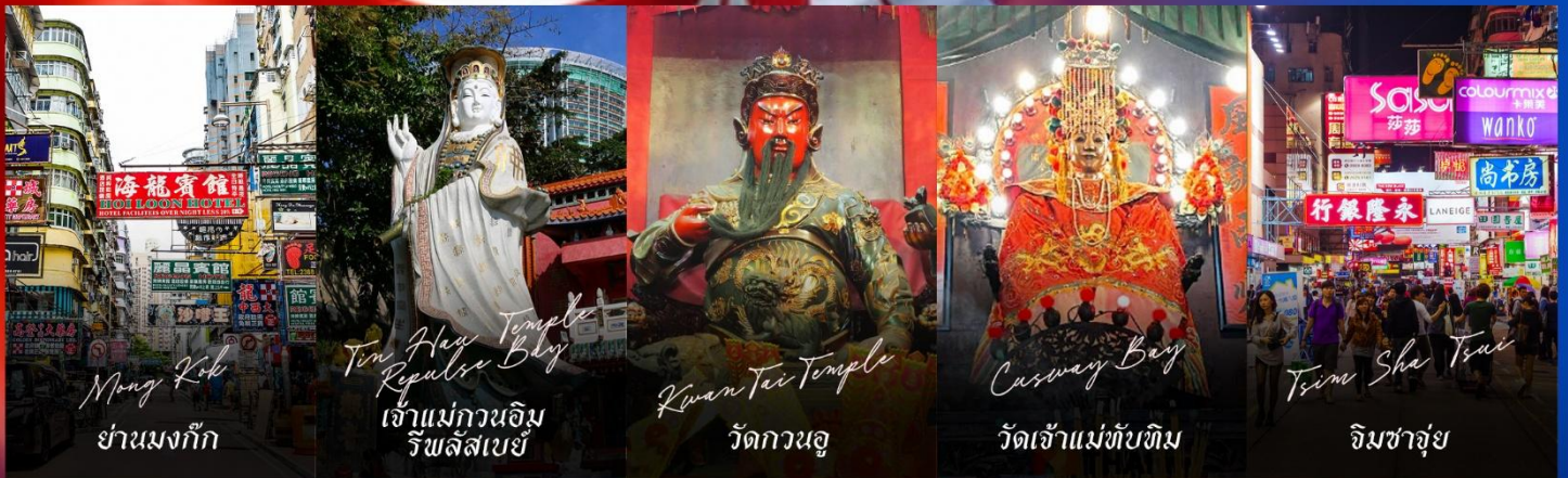
Mong Kok ย่านมงก๊ก

รายการทัวร์ข้างต้นอาจมีการปรับเปลี่ยนเพื่อความเหมาะสม