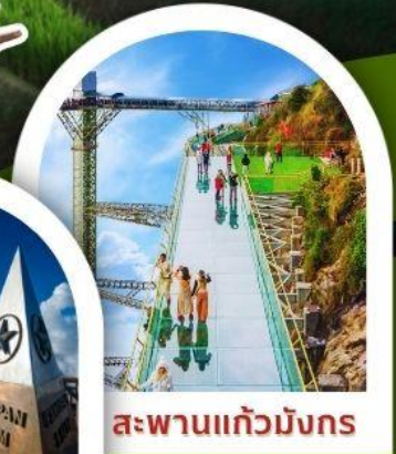
สะพานแก้วมังกร