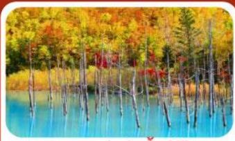
บลูพอนด์ (บ่อน้ำสีฟ้า)