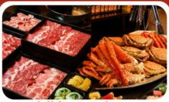
บุฟเฟ่ต์ซาบู ซาปู 3 ชนิด