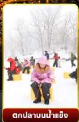
ตกปลาน้ำแข็ง