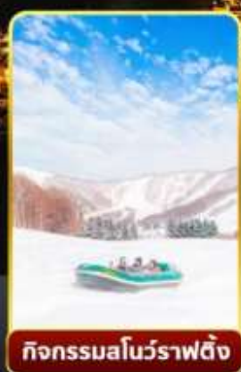
กิจกรรมสโนว์ราฟติง