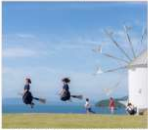
Shodoshima Olive Park เกาะมะกอก