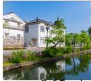
เขตอนุรักษ์เมืองเก่า คุราชิกิ