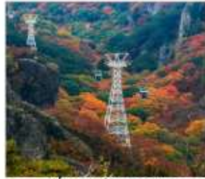
นั่งกระเช้าชมภูเขา ดังดาเดอิ