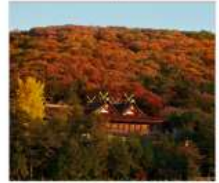
ศาลเจ้าคิโนะชิอิโกะ