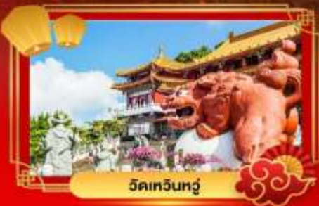
วัดเหวินทู่